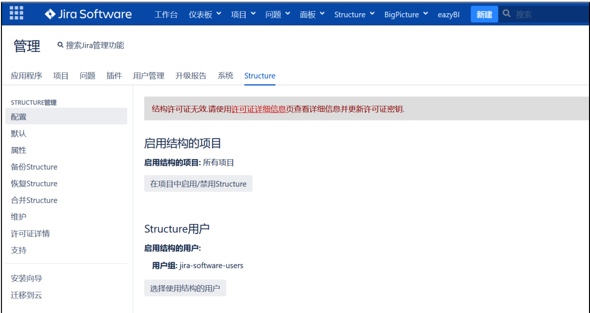
translate into Chinese language effect display (Management Interface 1)